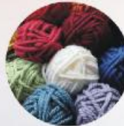
DONACIONES DE LANA