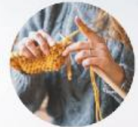
PERSONAS QUE QUIERAN REALIZARLOS

"A veces sentimos que lo que hacemos es una gota en el mar, pero el mar sería menos si le faltara una gota"