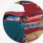
CUADRADITOS TEJIDOS DE 20X20